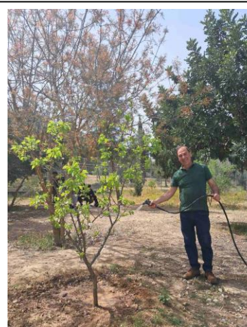
Ο σχολικός κήπος ποτίζεται από διάτρηση, πρακτική που οδηγεί στην εξάντληση των αποθεμάτων των υπόγειων υδάτων.