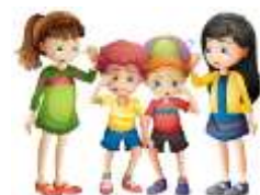
des enfants tristes : ils pleurent.