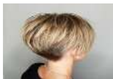
des cheveux blonds et courts