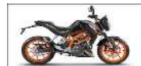
une belle moto