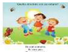
des enfants contents, (ευχαριστημένα) heureux (ευτυχισμένα)